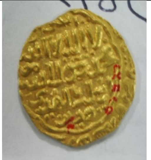
صورة رقم (٣) دينار للسلطان قلاوون بالكتابات المعتاده رقم سجل ١٢/٢٣٥٢٥ المتحف الإسلامي