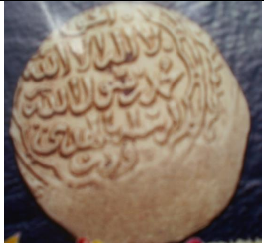
صورة رقم (٢) دينار المنصور قلاوون متحف الفن الإسلامي رقم سجل ١٥/١٤٧١٣