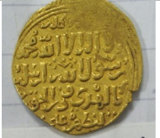
صورة رقم (٤) دينار الاشرف خليل - متحف الفن الإسلامي رقم سجل ١٨/١٤٧١٣